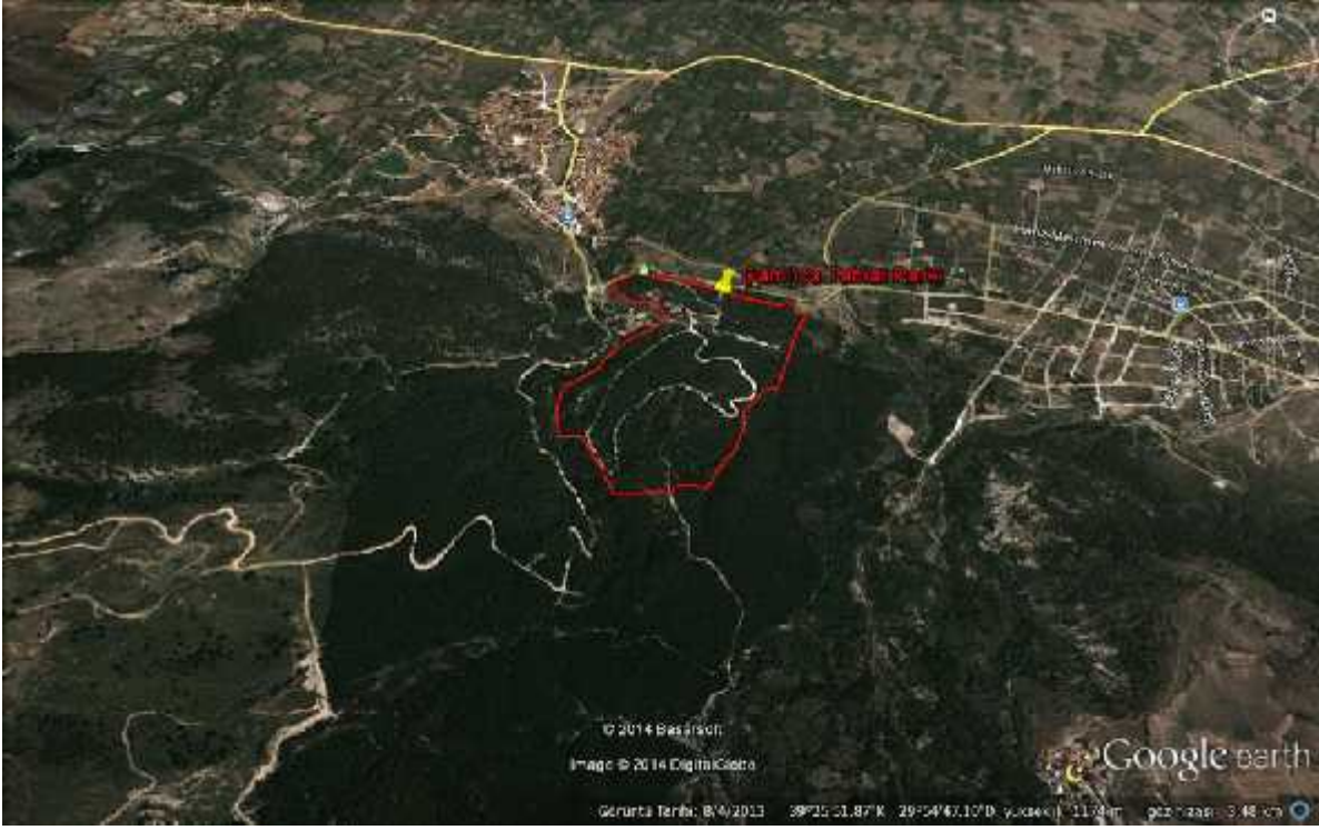
Harita 1: Çamlıca Tabiat Parkı'nın Uydu Görüntüsü ( www.ormansu.gov.tr.-E-Hizmetler-GeoData )

A.3. Sahanın Genel Tanımı: Kütahya ili Merkez ilçesinde bulunan Çamlıca Tabiat Parkı, Kütahya iline 7 km.uzaklıktadır. Kütahya, Ege Bölgesi'nin ç Batı Anadolu Bölümü'nde yer alır. ç Anadolu Bölgesi ile denize kıyısı olan Ege Bölümü arasında geçi alanıdır. Kütahya, kuzeyinde Bursa, kuzeydo usunda Bilecik, do usunda Eski ehir ve Afyon, güneyinde U ak, batısında Manisa ve Balıkesir illeriyle çevrilidir. Planlama alanının toplam büyüklü ü 35 ha.dır. Planlama alanı, Afet leri Genel Müdürlü ü Deprem Ara tırma Dairesi tarafından yayınlanan Türkiye Deprem Bölgeleri Haritası'nda 2. derece deprem bölgesi ku a ında yer almaktadır. ( Çamlıca Tabiat Parkı, Geli me Planı, Kent Planlama Ofisi, 2012)