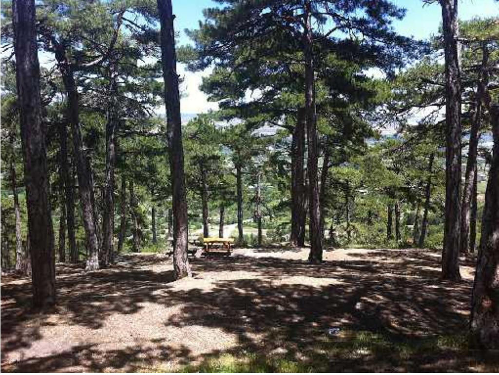
Foto 1. Çamlıca Tabiat Parkı