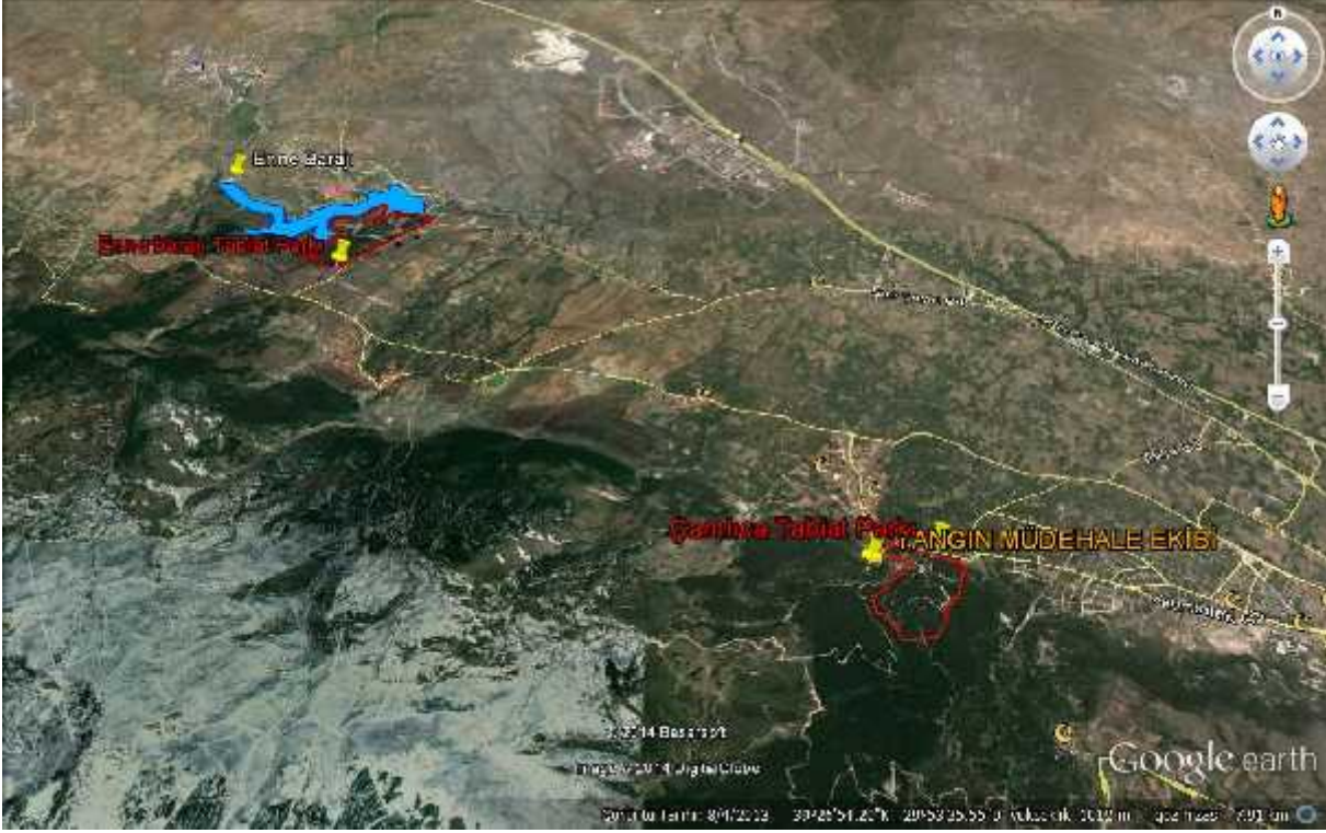
Harita 3: Yangınla Mücadele Su Kaynakları Uydu Görüntüsü

B.7. Sahaya Ulaşım Kolaylığı (Yol A1 ve yolların durumu) : Çamlıca Tabiat Parkı'na giden asfalt yol mevcuttur.