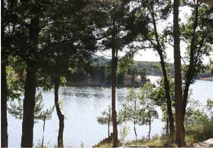
Foto 1. Enne Barajı Tabiat Parkı