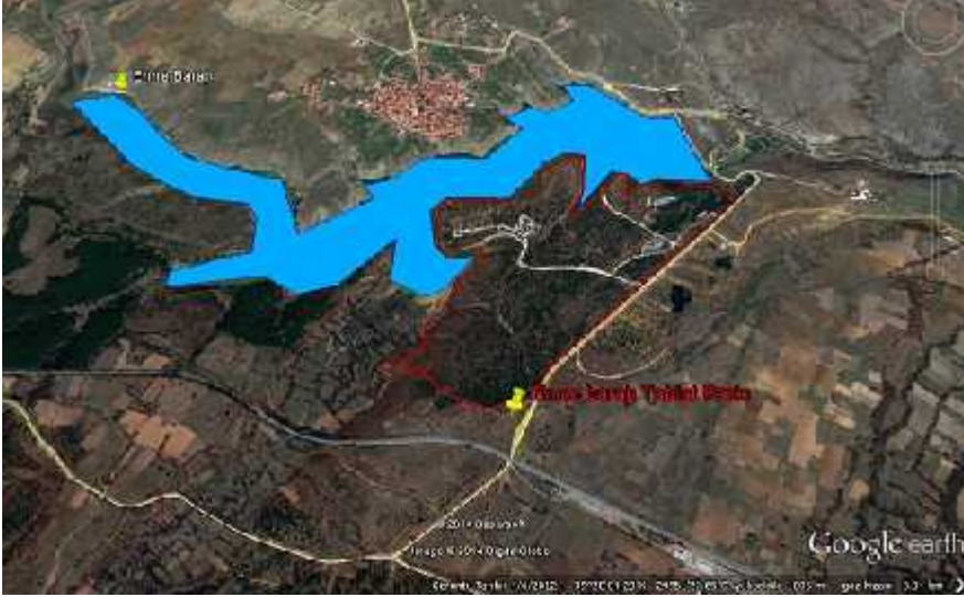
Harita 3: Yangınla Mücadele Su Kaynakları Uydu Görüntüsü

B.7. Sahaya Ulaşım Kolaylığı (Yol A1 ve yolların durumu) : Tabiat Parkı'nın 1 Merkezine uzaklığı 25 km. olup, asfalt yoldan alana ulaşılabilir.