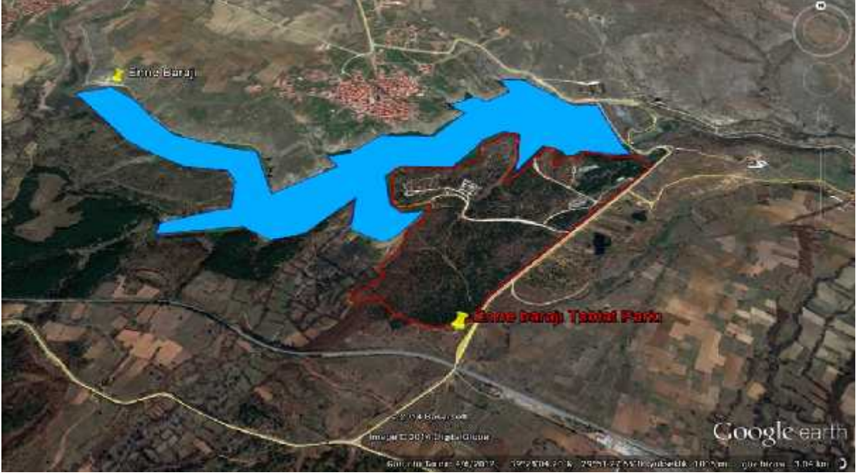
Harita 1: Enne Barajı Tabiat Parkı'nın Uydu Görüntüsü ( www.ormansu.gov.tr.-E-Hizmetler-GeoData )

A.3. Sahanın Genel Tanımı: Halkımızın dinlenme, eğlenme ve piknik gibi rekreasyonel ihtiyaçlarını en iyi şekilde karşılayan gölet manzaralı sahada yeşil ile mavi iç içedir. Yoğun ziyaretçi potansiyeli olan alanda Karaçam ve Meşe ağaç türü hakimdir. Tabiat Parkı'nın doğusunda ormanlık alan, batısı ve kuzeyinde Enne Barajı Göleti, güneyinde ise Kütahya Enne Köyü asfalt yolu bulunmaktadır. Tabiat Parkı'nın İl Merkezine uzaklığı 125 km. olup, asfalt yoldan alana ulaşabilmektedir. Alanın tamamı 47,2 ha.'dır. En yakın yerleşim yerleri; Enne ve Demirciören köyleridir.