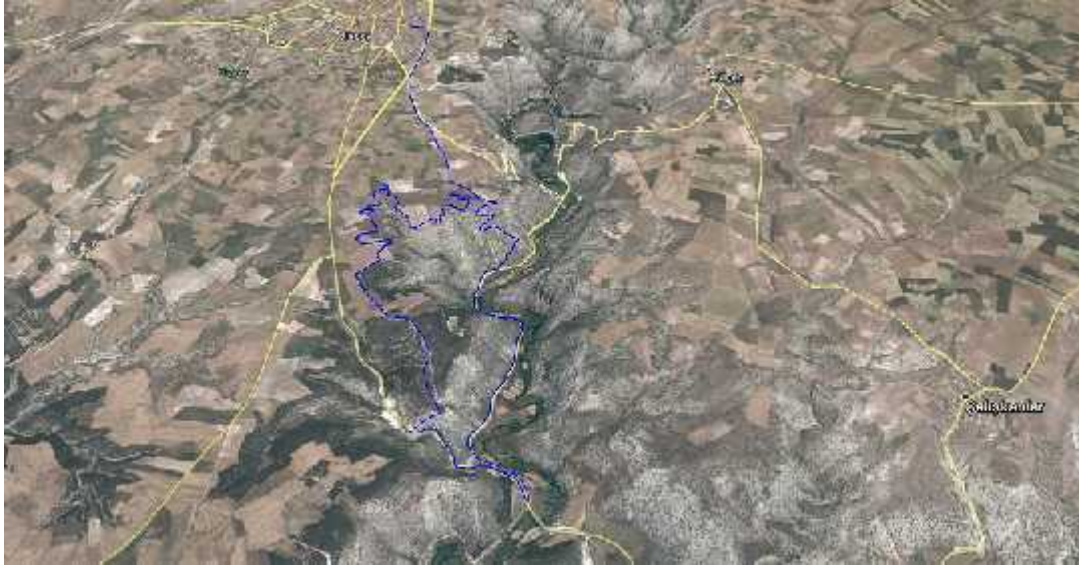
Harita 2. Ulubey Kanyonu Tabiat Parkı'na yakın yerleşimlerin uydu görüntüsü

gösterildiği uydu görüntüsü Harita 2.'de verilmiştir.