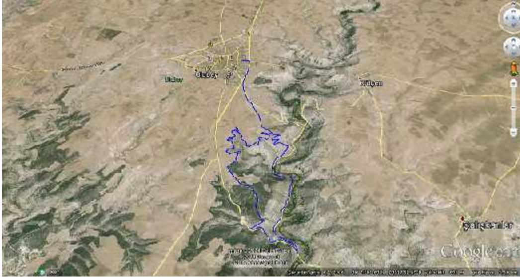
Harita 1: Ulubey Kanyonu Tabiat Parkı Sınırlarını Gösterir Harita

Sahaya ait koordinatlar Tablo 1'de, sahanın uydu görüntüsü ise Harita 1'de verilmiştir.